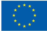
UNION EUROPÉENNE Fonds européens structurels et d'investissement

Le logo de l'Union européenne doit être accompagné de la mention du ou des fonds concerné(s) : « Fonds Européen de Développement Régional/ Fonds Social Européen/ Fonds Européens Structurels et d'Investissement (si plusieurs fonds) ».